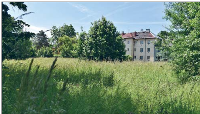
NA MÍSTĚ plánovaných domů je jen postupně zarůstající pozemek.

V městském obvodu Mariánské Hory a Hulváky v lokalitě U Dvoru měly před mnoha a mnoha lety vyrůst nové bytové domy. Na pozemku o velikosti více než 6000 m 2 byla provedena demolice původních domů a nic nebránilo tomu, aby vedení obce v roce 2006 podepsalo smlouvu s investorem. Tím byla španělská firma, cena pozemku tehdy obvyklá činila 3,5 milionu korun a nic nebránilo tomu, aby se toto území proměnilo v pohodovou a útulnou rezidenci s pěti objekty a více než 150 byty.