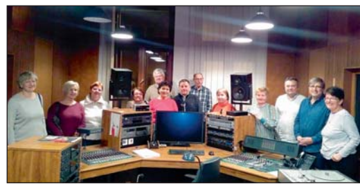
FREKVENTANTI seniorské hudební nauky na návštěvě ve studiu Českého rozhlasu Ostrava.

Dobrých zpráv a pozitivních skutečností je v současnosti velmi třeba a jednou z nich je otevření nového tříletého cyklu Akademie, který začne zase v září 2021, opět na ZUŠ E. Marhuly. Celou akci znovu finančně podpoří Moravskoslezský kraj, statutární město Ostrava a nově také ÚMOB Ostrava – M. Hory. Ke studiu zveme především „domácí“ seniory mariánskohorské, k dnešním dni je jich přihlášeno 22 z celkových 96 studujících. Doplníte řady nadšených hudebníků, vý-